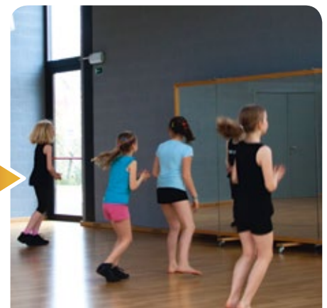
Samen met Vlaanderen zorgt Holsbeek ervoor dat onze kinderen en jongeren kunnen sporten in de lokale clubs