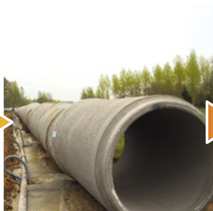
Vlaanderen zorgt samen met Holsbeek voor proper water in de Winge en Losting