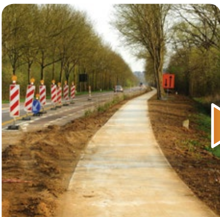
Minister Hilde Crevits antwoordde volmondig ja om gescheiden fietspaden aan te leggen langs de Rijksweg N223

Zonder samen te werken met buurgemeenten, met onze mensen in de provincie of met de parlementairen en ministers lukt het niet om u de leefomgeving te bieden die u verdient. Dat doen we, al jarenlang. De resultaten, daar geniet u reeds elke dag van. Daarom is uw stem op uw lokale kandidaat zo belangrijk: voor uw fietspad, rondpunt of bib... Kies op 25 mei voor uw lokale kandidaten en kies voor een partij die al zoveel keer bewezen heeft, dat ze kan samenwerken. Een zekerheid waar je een sterke toekomst kunt op bouwen. Ook in uw gemeente.